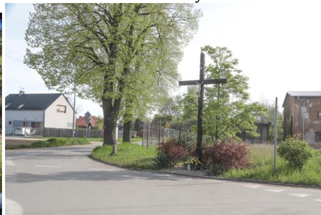
Krzyż przy skrzyżowaniu