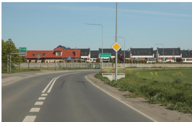
Wjazd do Radomierzyc