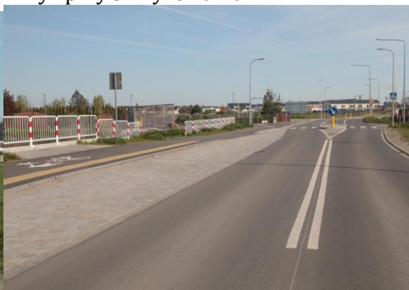
Główna droga w Radomierzycach