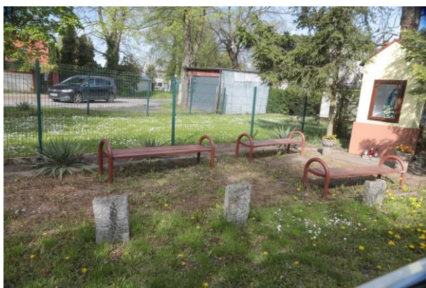
Kapliczka z ławkami