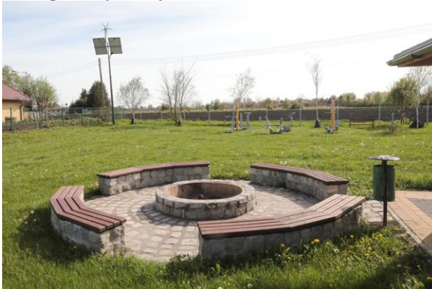
Miejsce na ognisko