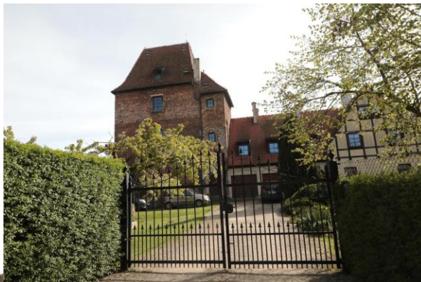
Średniowieczna wieża rycerska