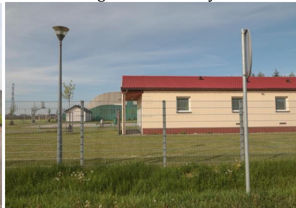
Budynek socjalny na boisku sportowym