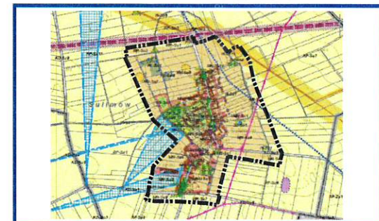
WYRYS ZE STUDIUM UWARUNKOWAŃ I KIERUNKÓW ZAGOSPODAROWANIA PRZESTRZENNEGO GMINY SIECHNICE